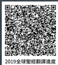
2019全球聖經翻譯進度