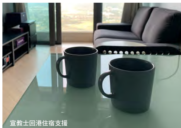
宣教士回港住宿支援